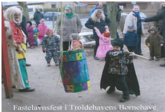
Fastelavnsfest i Troldehavens Børnehave