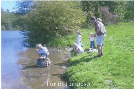
Tur til Langesø